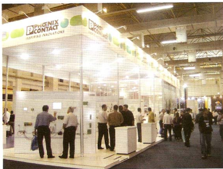
Stand da Phoenix Contact

Protetor contra surtos para dispositivos de medição e a tecnologia de segurança para redes Interbus e Profinet foram os lançamentos da Phoenix Contact. O novo equipamento de proteção contra surtos Surgetrab